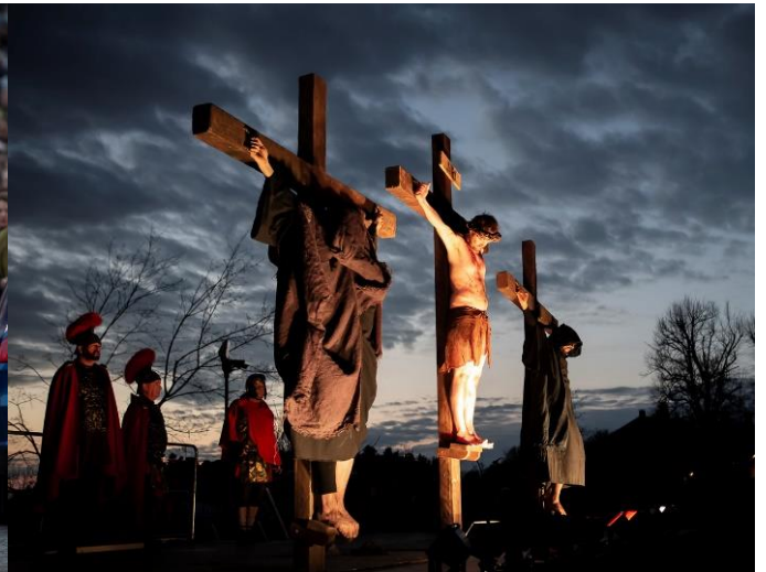
Via Crucis – berörande påskdrama mitt i Gamla stan