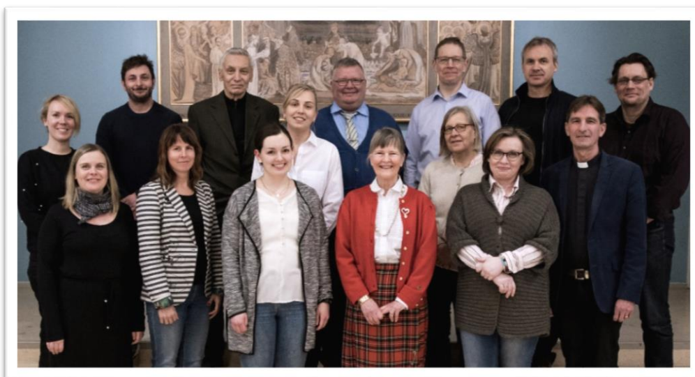
Förtroendevalda i Församlingsrådet bär ansvar